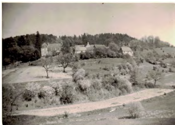
PHOTO 3.3 – Vue des Fraux en 1953. On voit que la route vers Montignac n'est pas encore goudronnée

Cette situation a perduré longtemps. La photographie ci-dessous montre une vue de la route allant de La Bachellerie à Montignac en 1953, dont on voit bien qu'elle n'est pas goudronnée.