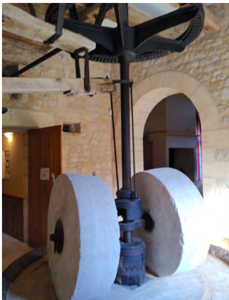
PHOTO 8.1 – Vue des meules destinées à produire l’huile de noix. Les dents de l’engrenage sont en bois

Bien sûr, les manières de travailler ont beaucoup évolué avec les machines et l’informatique. On a gagné en efficacité, mais perdu en pertinence technique, il y a aussi eu des pertes de savoir-faire humain.