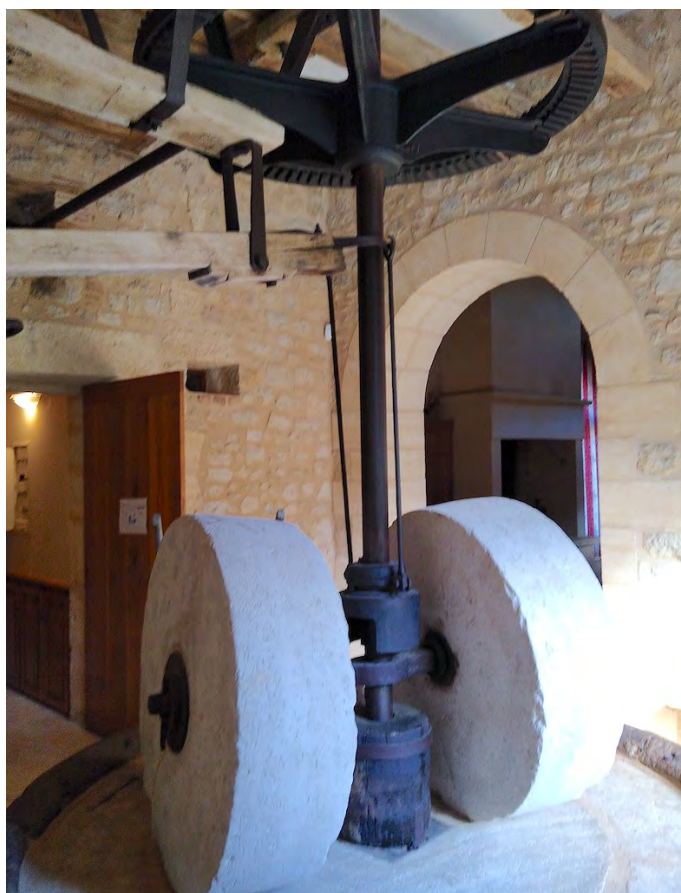
PHOTO 8.1 – Vue des meules destinées à produire l’huile de noix. Les dents de l’engrenage sont en bois