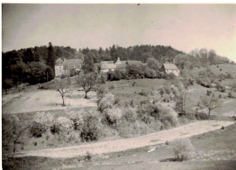
PHOTO 3.3 – Vue des Fraux en 1953. On voit que la route vers Montignac n'est pas encore goudronnée

Cette situation a perduré longtemps. La photographie ci-dessous montre une vue de la route allant de La Bachellerie à Montignac en 1953, dont on voit bien qu'elle n'est pas goudronnée.